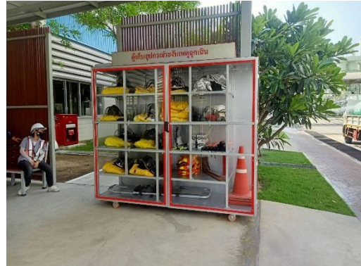
รูปที่ 42 อุปกรณ์ชุดผจญเพลิง