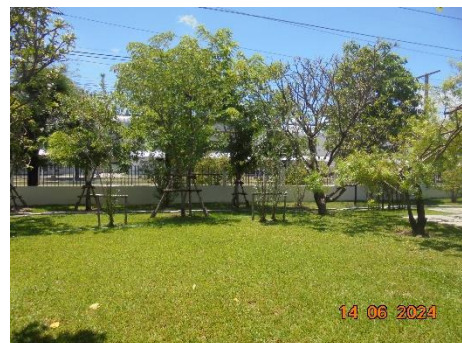
รูปที่ 8 แนวต้นไม้รอบโรงงานเพื่อป้องกันเสียงและฝุ่น