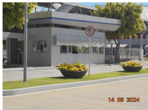
รูปที่ 11 ป้ายจำกัดความเร็วของรถภายในพื้นที่โครงการ