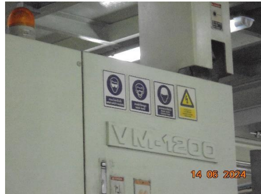
รูปที่ 10 ป้ายกำหนดการสวมใส่อุปกรณ์ป้องกันอันตรายส่วนบุคคล