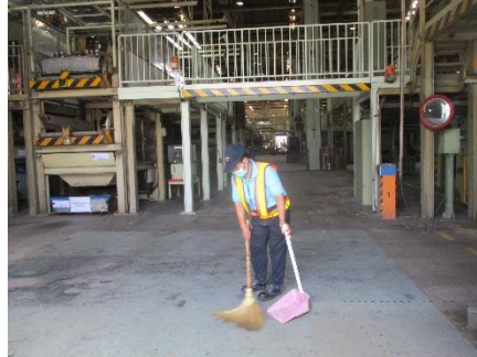
รูปที่ 50 การทำความสะอาดบริเวณที่มีการฟุ้งกระจายของฝุ่น