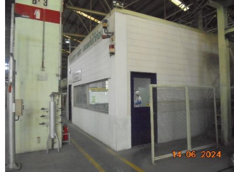
รูปที่ 6 ห้องควบคุม (Control Room) เพื่อลดการสัมผัสเสียงดังของพนักงาน