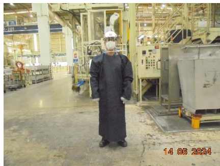
รูปที่ 49 การสวมใส่อุปกรณ์ป้องกันอันตรายส่วนบุคคล บริเวณหน้าเตาหลอมอลูมิเนียม