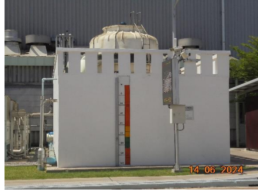
โรงงานหล่อฝาสูบเครื่องยนต์อลูมิเนียม