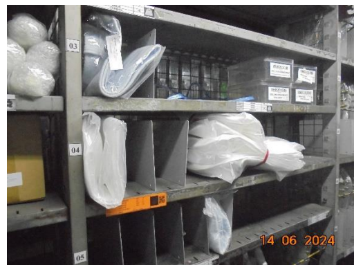
รูปที่ 3 ถังกรองสำรองสำหรับระบบบำบัดฝุ่น