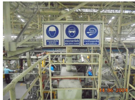
รูปที่ 7 ป้ายเตือนให้พนักงานสวมใส่อุปกรณ์ลดเสียงบริเวณที่มีเสียงดัง