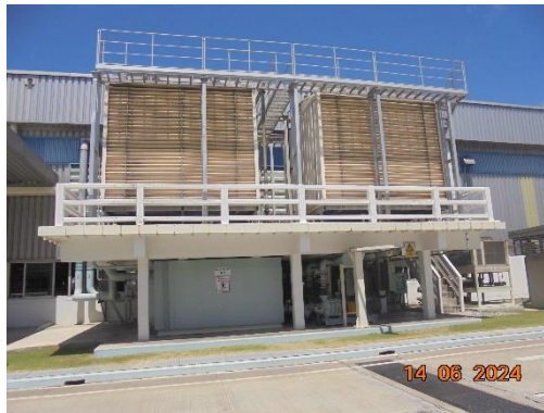
โรงผลิตชิ้นส่วนเครื่องยนต์แก๊สโซลีนจากอลูมิเนียม