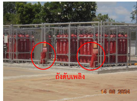
รูปที่ 52 ระบบสัญญาณแจ้งเหตุเพลิงไหม้อัตโนมัติ และอุปกรณ์ดับเพลิง บริเวณพื้นที่จัดเก็บถังก๊าซไฮโดรเจน