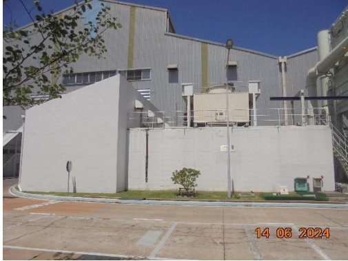
โรงงานเหล็กหล่อเสื่อสูบ