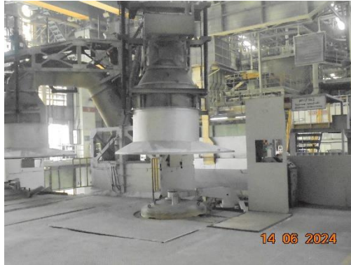
รูปที่ 1 Canopy Hood โรงงานเหล็กหล่อเสื้อสูบ