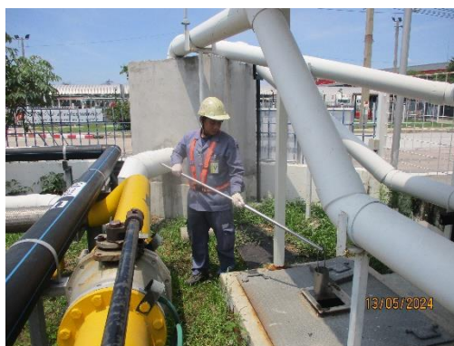
รูปที่ 5 บ่อพักน้ำสุดท้ายก่อนปล่อยสู่ระบบบำบัดน้ำเสียส่วนกลางในนิคมอุตสาหกรรม