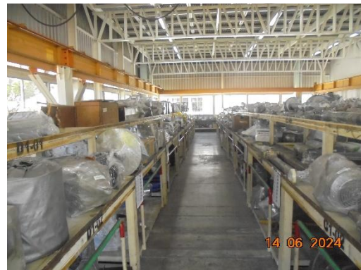
รูปที่ 2 อะไหล่สำรอง พร้อมใช้งานสำหรับระบบบำบัดฝุ่น และอุปกรณ์ที่ใช้ในกระบวนการผลิต