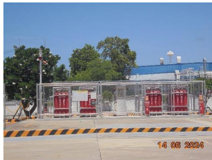
รูปที่ 53 รั้วโปร่งรอบพื้นที่จัดเก็บถังก๊าซไฮโดรเจน