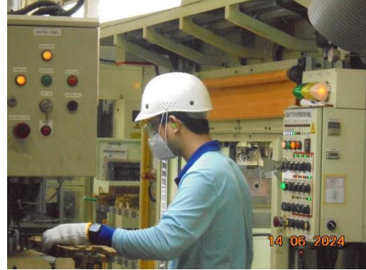
รูปที่ 9 พนักงานสวมใส่อุปกรณ์ลดเสียง