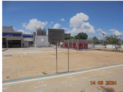
รูปที่ 54 ป้ายความปลอดภัยบริเวณสารไวไฟ