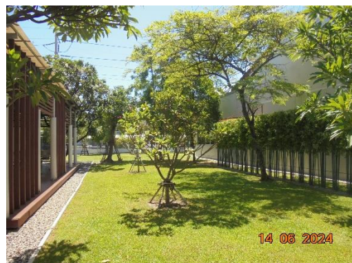
รูปที่ 55 พื้นที่สีเขียวภายในโครงการ