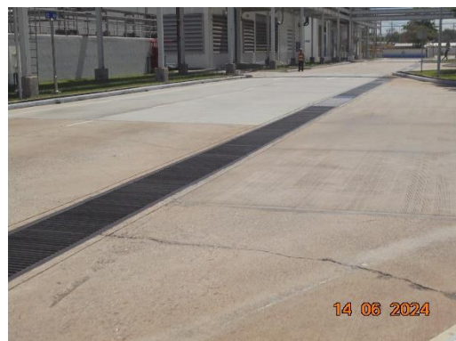
รูปที่ 12 รางระบายน้ำรอบพื้นที่โครงการ