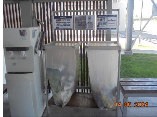
รูปที่ 13 การแยกขยะตามจุดต่างๆ ภายในพื้นที่โครงการ