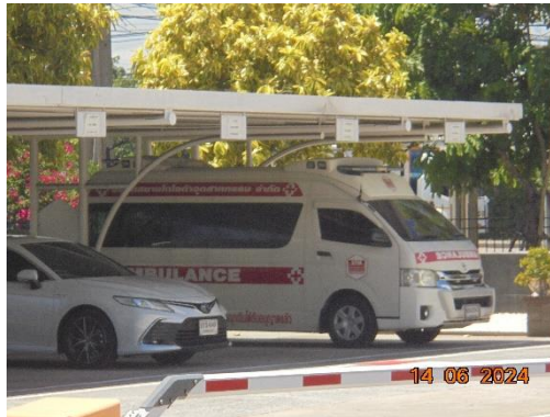
รูปที่ 45 ห้องพยาบาล และรถฉุกเฉิน