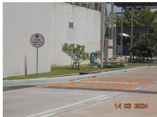
รูปที่ 44 จุดรับพนักงานกรณีเกิดเหตุฉุกเฉิน