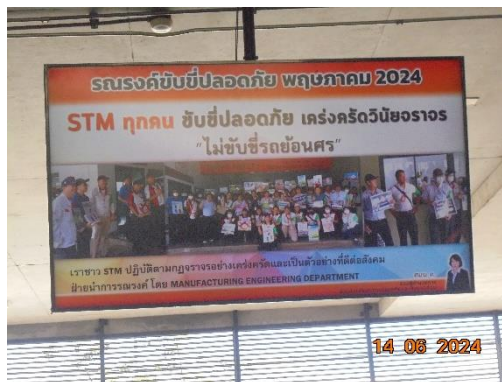
รูปที่ 37 การรณรงค์วัฒนธรรมความปลอดภัยใน STM