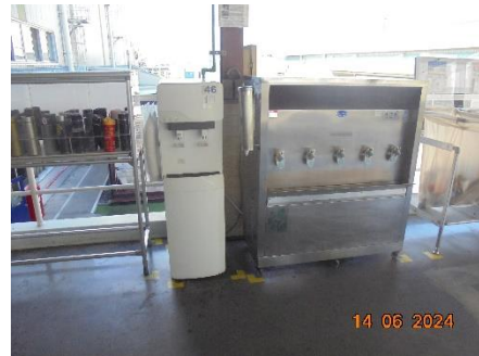
รูปที่ 46 จุดน้ำดื่มสำหรับพนักงาน