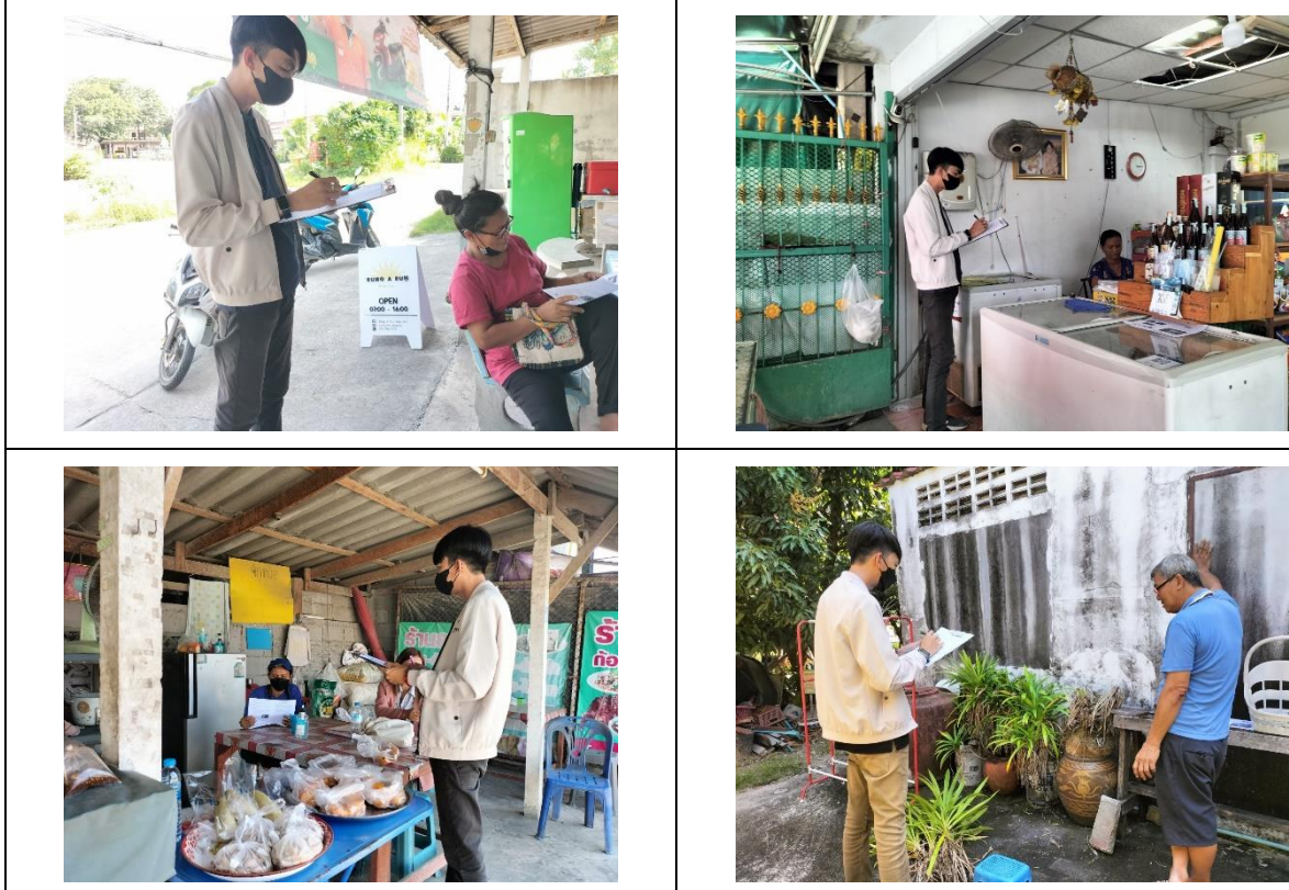
รูปที่ 36 การสำรวจความคิดเห็นของประชาชน รัศมี 5 กิโลเมตร