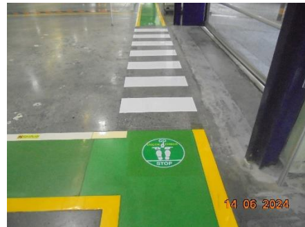
รูปที่ 51 เครื่องหมายแสดงทางเดิน