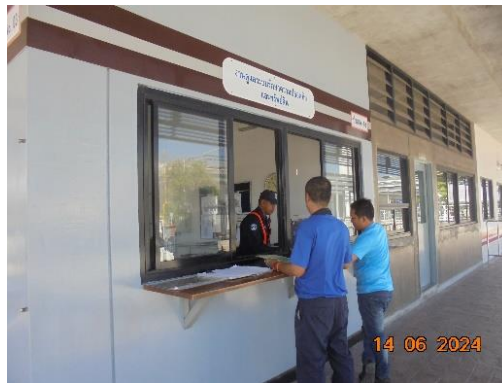
รูปที่ 43 ป้อมหน่วยรักษาความปลอดภัยภายในโครงการ